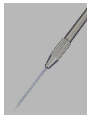
ピペットホルダーにマイクロピペットを取り付けた状態